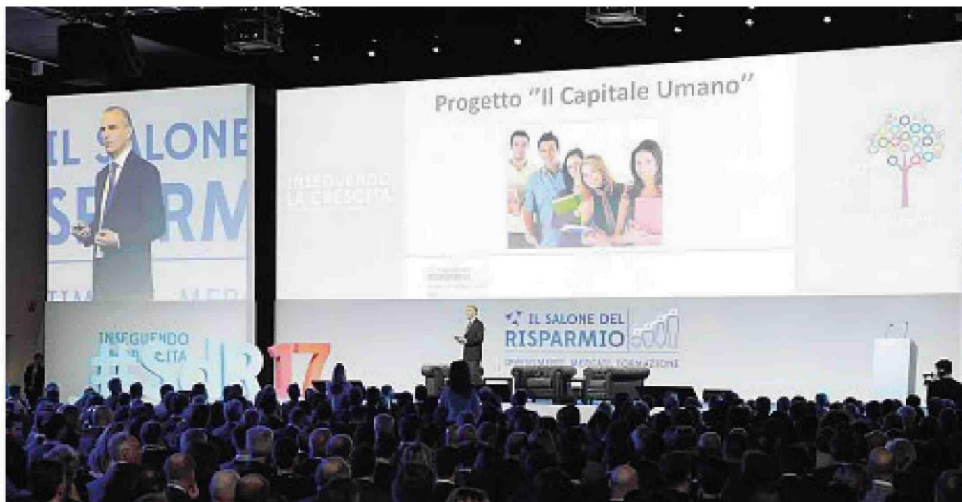
L'evento La presentazione della prima edizione de «Il tuo capitale umano» al Salone del Risparmio 2017